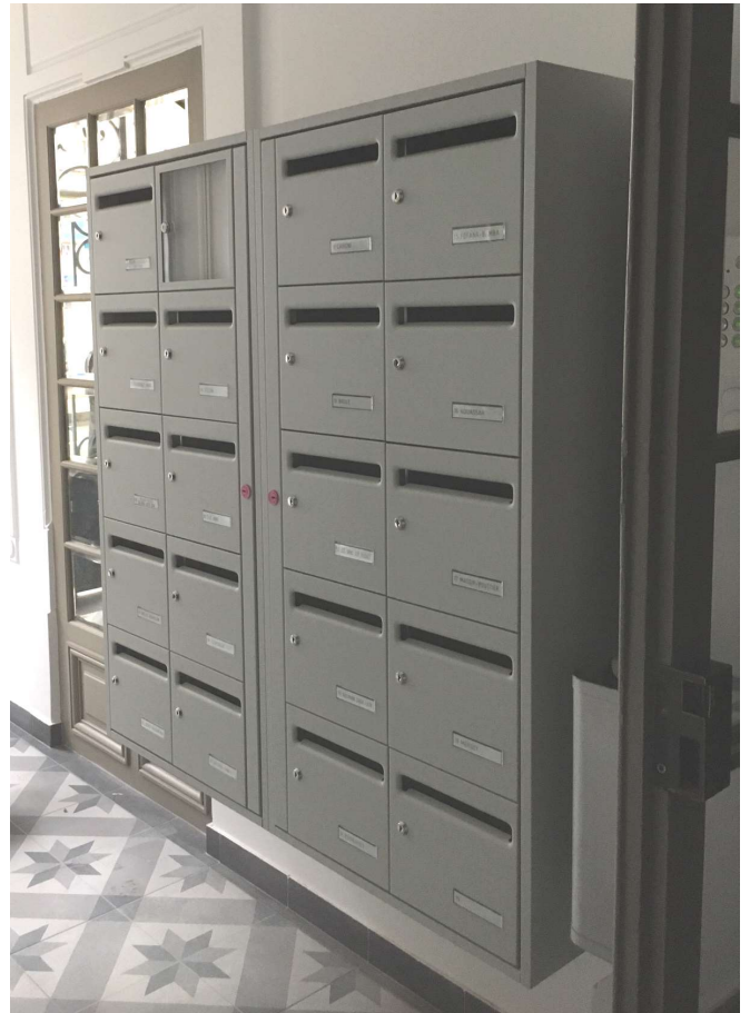
Portillons et coffre : GRIS LUMIERE