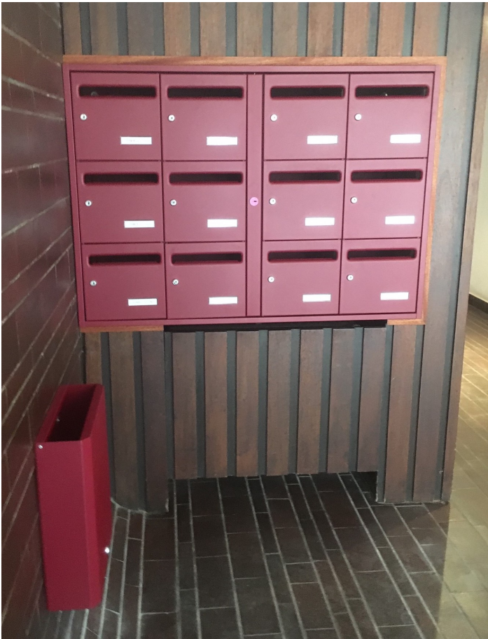
Portillons et coffre : ROUGE POURPRE